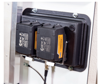
Two light weight Li-Ion batteries mounted on the machine