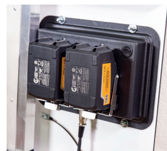
Zwei leichte Li-Ionen Akkus direkt am Gerät montiert